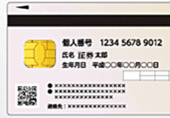
個人番号カード(裏)