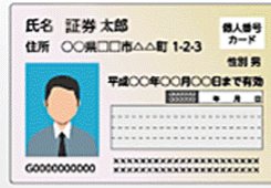
個人番号カード(表)