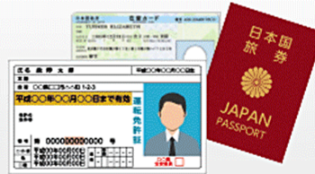
運転免許証やパスポートなど